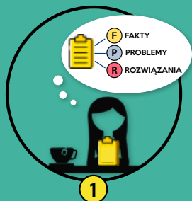
1 Samodzielna praca z kazusem

Osobista analiza przedstawionej historii poprzez wynotowanie faktów i problemów dostrzeżonych przez uczestnika oraz zaproponowanie możliwych rozwiązań.