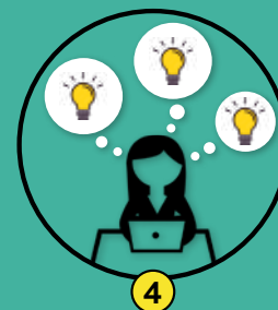
4 Praca samodzielna

Etap ten służy uporządkowaniu i zebraniu w całość omawianego tematu oraz krótkiemu podsumowaniu go przez moderatora. Spotkanie trwa około 1,5 h.